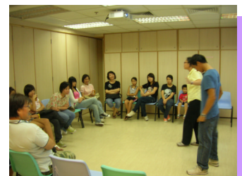
家長及青少年 小組活動