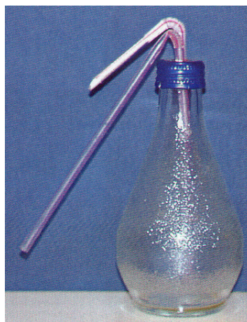
來歷不明的粉狀物質↓